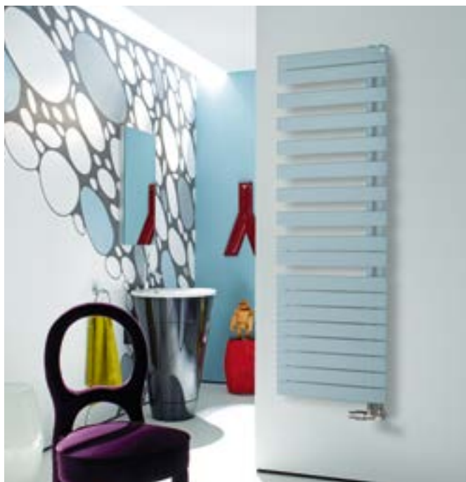
Radiátor színe: Pacific Blue